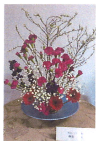
池坊いけばな教室