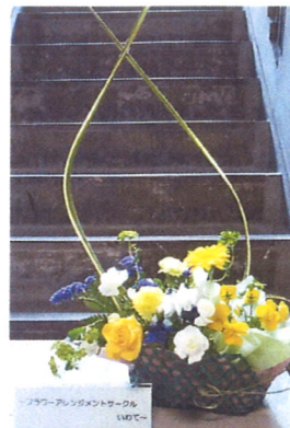
フラワーアレンジメントサークルいわて