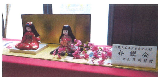
伝統工芸江戸木目込人形 邦纒会