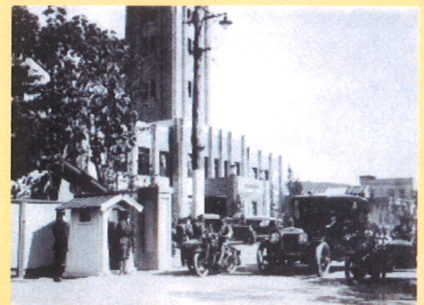
大本営御出門の風景 1928年